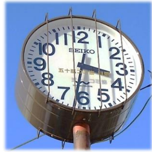
50周年記念掛け時計